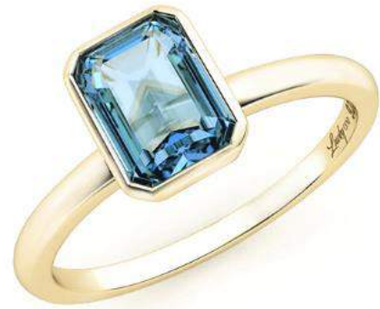
Topaze Bleue Suisse

LUCKY ONE apporte une réponse aux nouvelles tendances du secteur du luxe Digital – Personnalisation - Expérience Client - Production Responsable